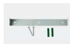
Készlet falra szereléshez